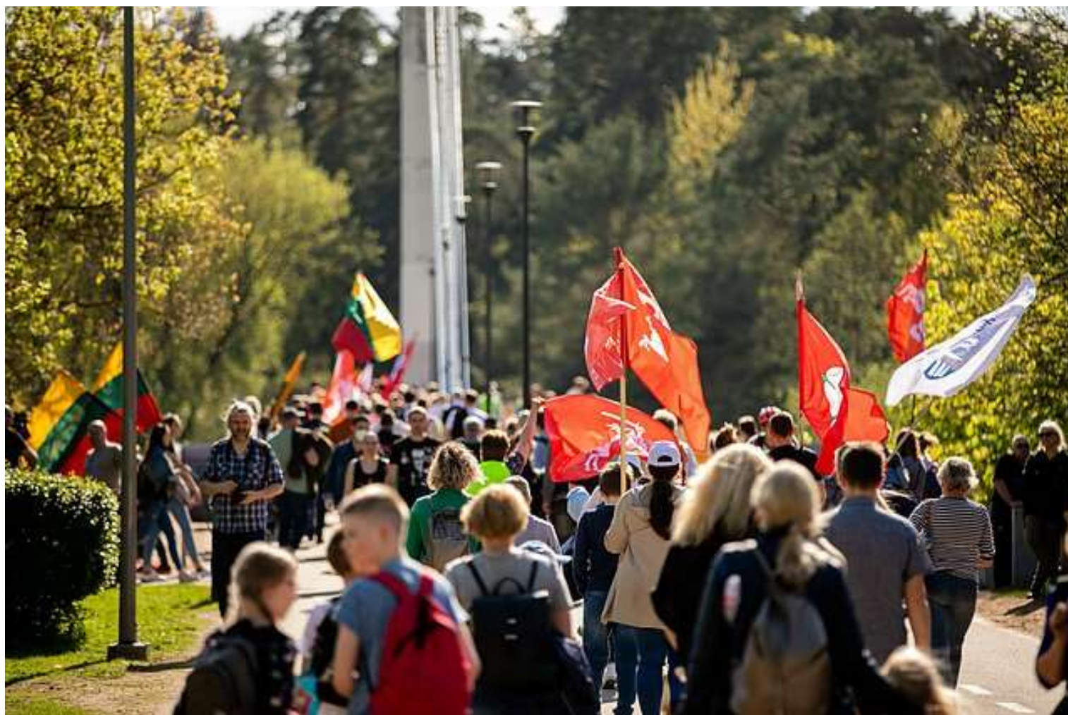
„Didysis šeimų gynimo maršas“

LRT: Didžiojo šeimų maršo metu sveikinimą išplatino šalies prezidentas Gitanas Nausėda. Anot jo, šeimos labai dar padarėme per mažai. Mes privalome teisiškai sureguliuoti vienos lyties asmenų bendro gyvenimo klausimus, gerbiant jų teisę gauti informaciją apie partnerio sveikatos būklę, teisę į paveldėjimą, kitus svarbius klausimus. Tačiau tai turi būti daroma laikantis Lietuvos Respublikos Konstitucijos 38 straipsnio, kuriame teigiama, kad šeima yra visuomenės ir valstybės pagrindas, o santuoka sudaroma laisvu vyro ir moters sutarimu. Kaip Lietuvos Respublikos prezidentas, pasinaudosiu savo galiomis, kad taip ir būtų“, - tvirtino G. Nausėda.