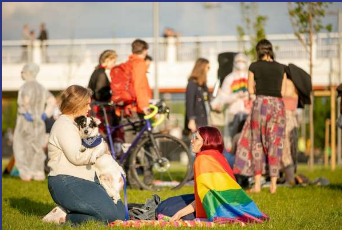
LGBT rėmėjai surengė piketą prieš „Didįjį šeimos gynimo maršą“